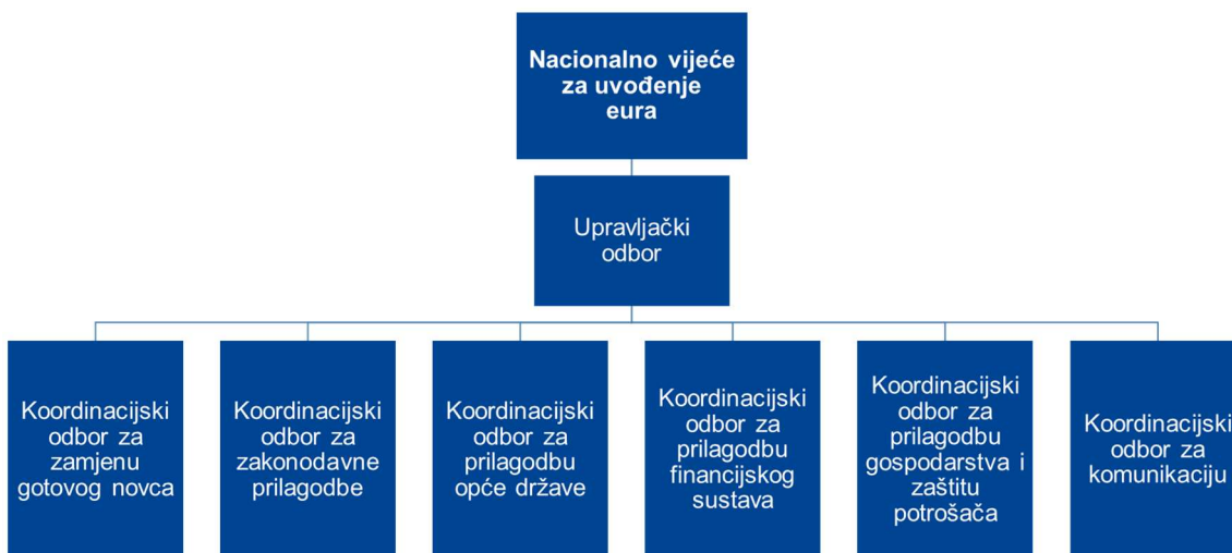
Slika 1. Koordinacijska tijela u postupku uvođenja eura