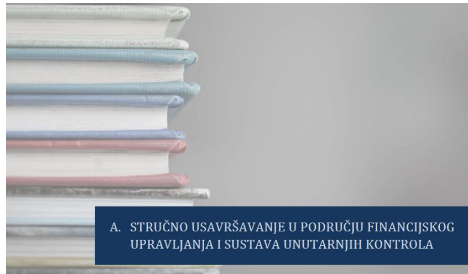
| KATALOG IZOBRAZBE 2024.

Do 30. lipnja 2024. održano je ukupno deset radionica iz područja sustava unutarnjih kontrola, u skladu s Katalogom izobrazbe za 2024. Sedam radionica održano je u online obliku, a tri su radionice održane uživo u prostorijama Državne škole za javnu upravu, i to „Provođenje kontrola na licu mjesta kod krajnjih korisnika transfera iz proračuna“ te u dva termina radionica „Odabir investicijskih projekata koji se financiraju sredstvima državnog proračuna i/ili proračuna JLP(R)S“. Online radionice bile su usmjerene na izobrazbu iz područja fiskalne odgovornosti te pripremu i predaju Izjave o fiskalnoj odgovornosti. Sveukupno je 1 339 polaznika pohađalo svih deset održanih radionica, u prosjeku 122 polaznika po radionici.